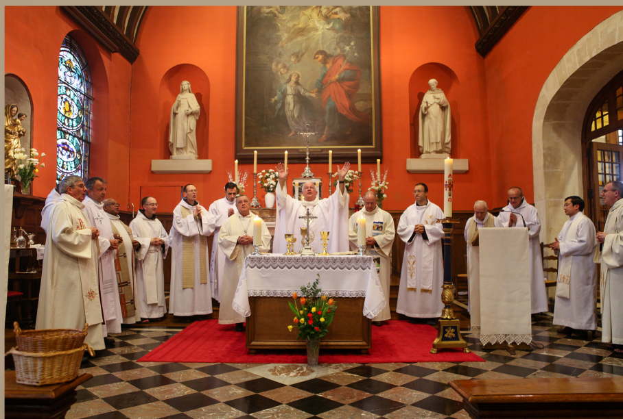
VÉNÉRATION DES RELIQUES DE BIENHEUREUSE MARIE DE L'INCARNATION