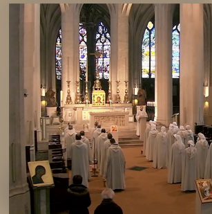
Fraternités Monastiques de Jérusalem de Paris