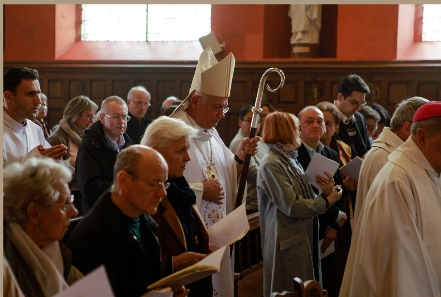
MESSE PRÉSIDÉE PAR MONSEIGNEUR STANISLAS LALANNE EVÊQUE DE PONTOISE