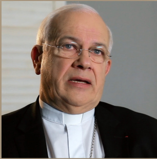
Msgr Stanislas Lalanne Evêque de Pontoise